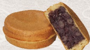
自家製つぶあんたっぷり 大判焼つぶあん