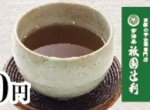
祇園辻利 ほうじ茶 税込 280円