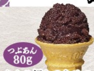
つぶあん 80g あんこ好きのための そのまんまあんこ 税込 150円