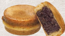
バターじゅわじゅわ 大判焼あんバター