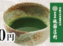
祇園辻利特選 お抹茶 税込 280円