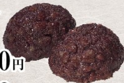
自家製つぶあん 手包みおはぎ