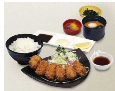
(写真)天ぷら和食処四六時中「ひとくち牡蠣フライ定食」